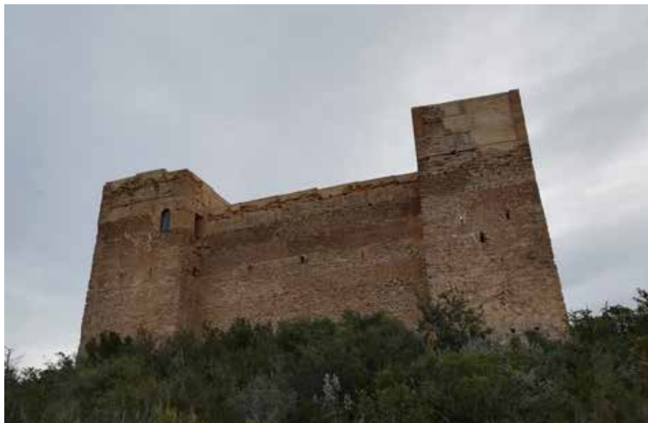
FIGURA 1. Castell de Forna. Josep Ahuir.

Albat dels Tarongers. La seua construcció abasta del XIV al XV. És el millor exemple de castell-palau gòtic valencià. De propietat particular, es troba en perill de ruïna. La seua planta és de 460 m 2 . Comptava amb sala noble, cavallerisses, almàssera, sales... Tal i com era habitual, comptava amb accés d'arc de mig punt, en este cas per una barbacana avançada.